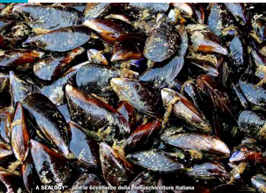
A SEALOGY®, con le eccellenze della molluschicoltura italiana