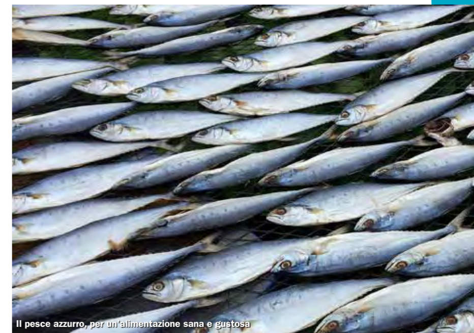
Il pesce azzurro, per un'alimentazione sana e gustosa