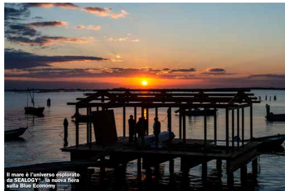
Il mare è l'universo esplorato da SEALOGY®, la nuova fiera sulla Blue Economy