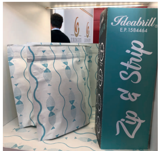
1) La Finpesca di Porto Viro (RO). 2) Presentare una fiera... in fiera. Sealogy, nuovo evento del "Mare in Italy", a Ferrara dal 6 all'8 marzo 2020. 3/4) Esseoquattro di Carmignano di Brenta (PD), packaging alimentare per alimenti freschi.

ai prodotti di marca industriale, in un panorama dei consumi di beni alimentari e non alimentari a crescita zero. L'interesse per Marca by BolognaFiere ha varcato i confini italiani accogliendo le delegazioni di buyer internazionali provenienti da 14 Paesi, grazie al programma di incoming sviluppato in collaborazione con ITA - Italian Trade Agency .