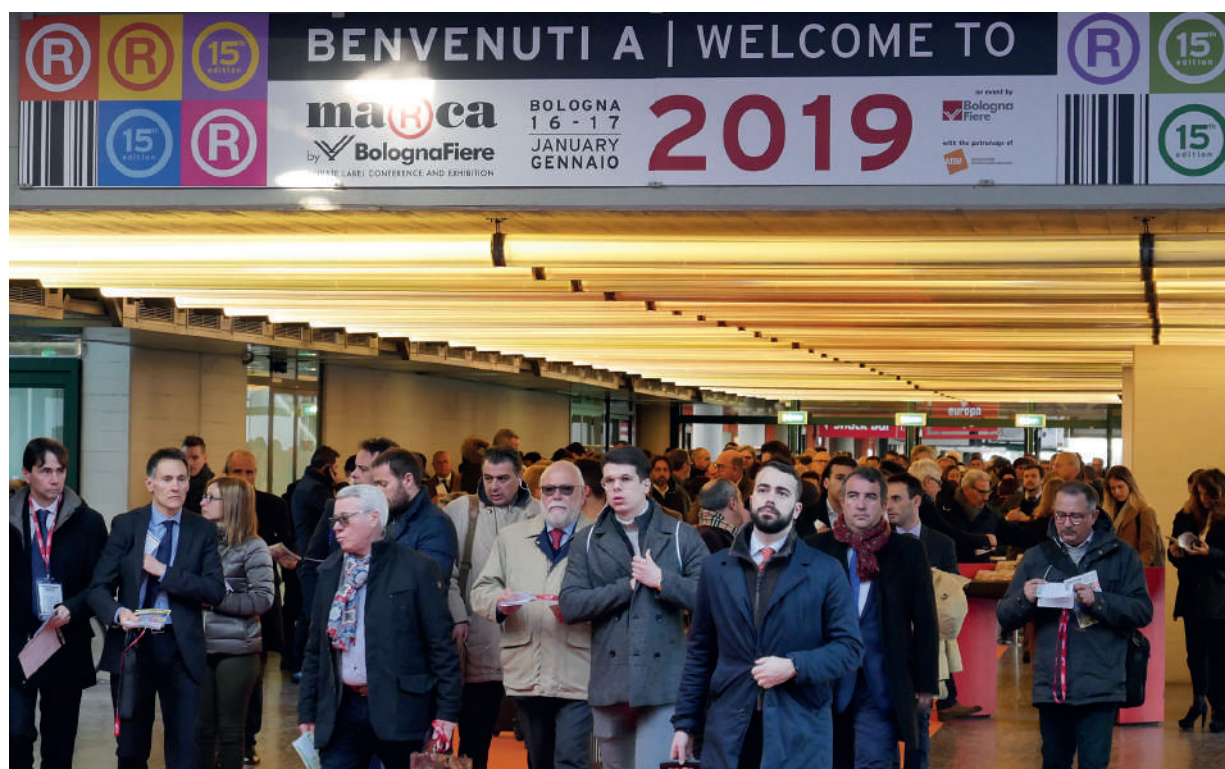
MarcabyBolognaFiere è l'unica manifestazione italiana dedicata in toto alla marca commerciale.

È un segmento di mercato in grande sviluppo, pesa ormai per 1 acquisto su 5 nella distribuzione moderna, fidelizza i consumatori, cresce in assortimento, linee e referenze e rappresenta la vera novità, rispetto